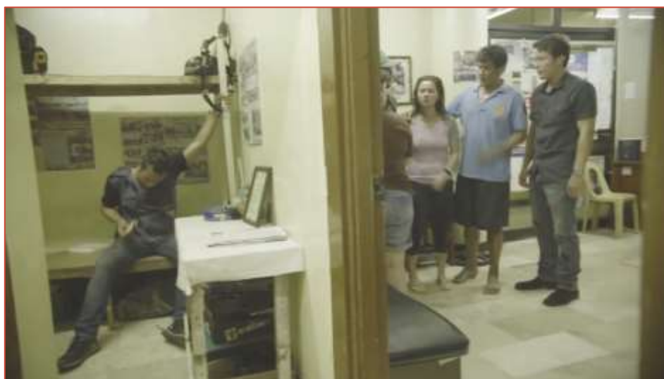
un film de Brillante Ma Mendoza

Présenté lors du dernier Festival de Cannes, Ma' Rosa avait permis à Jaclyn Jose de se voir récompenser du prix d'interprétation féminine. Le choix a été contesté par certains critiques, sans doute à juste titre, mais il est indéniable que les moments les plus intenses du film sont presque exclusivement ceux dans lesquels Brillante Mendoza concentre son regard sur l'actrice, en particulier durant toute la première partie. Nous y découvrons la vie quotidienne de Rosa, petite commerçante d'un quartier pauvre de Manille gérant son épicerie, son mari toxicomane, ses quatre enfants plus ou moins obéissants, les clients qui tardent à régler leur ardoise et son fournisseur de produits stupéfiants qui réclame son dû. Une descente de police bouscule son petit monde, le réalisateur passant alors du portrait d'un personnage à la description de la dynamique d'un groupe, Rosa n'étant plus qu'un élément parmi d'autres, contrainte par les règles imposées par des forces de l'ordre corrompues.